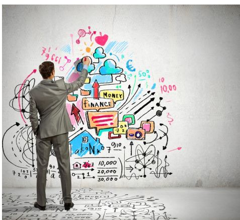
Ilustrační foto : Investiční plány